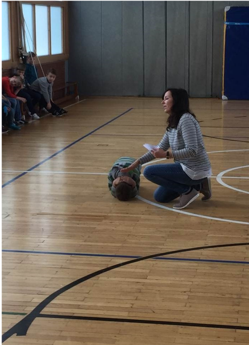
Das in der Theorie erlernte Verhalten wird vor dem Praxisteil noch einmal kurz anschaulich wiederholt.