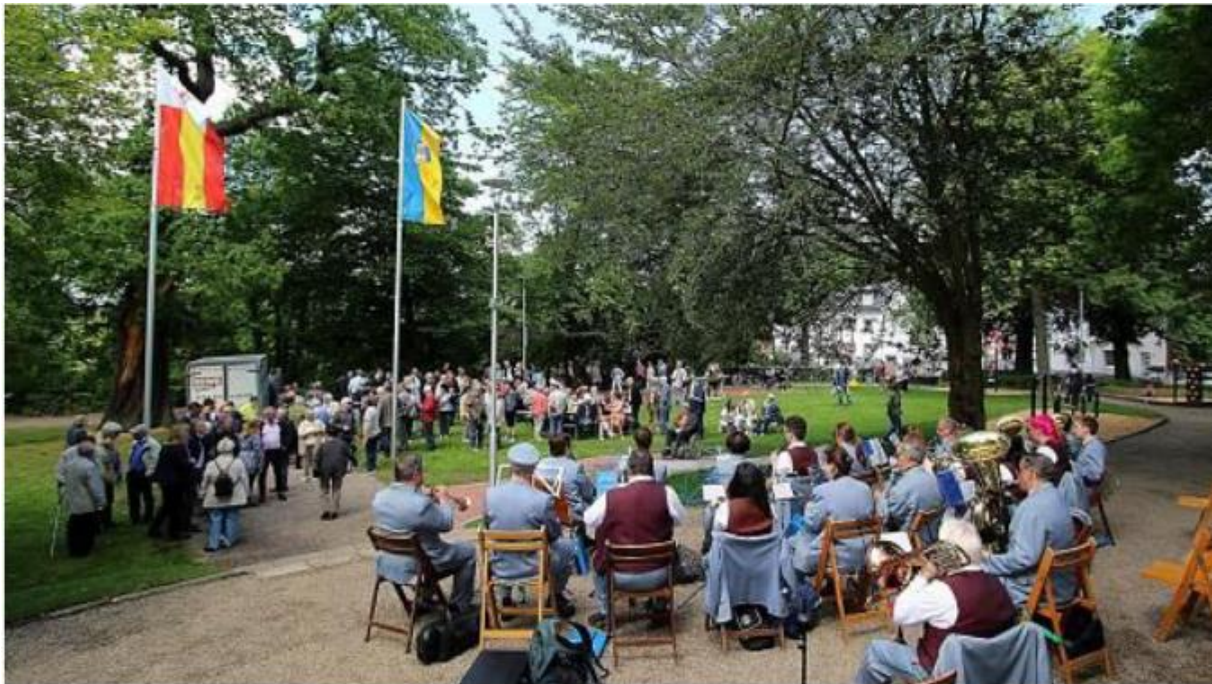
Allen Grund zum Feiern: Der Volkspark Merkstein präsentiert sich nach der Umgestaltung im neuen Glanz.

Am 20.05.2017 konnte die feierliche Einweihung des neuen Volksparks für Jung und Alt stattfinden.