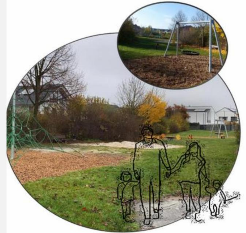
Spielplatz „Edith Stein Straße“

Lasst uns gemeinsam den Spielplatz attraktiver gestalten